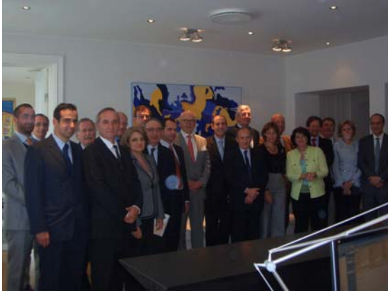
Asistentes a la Asamblea de COTANCE en Estocolmo