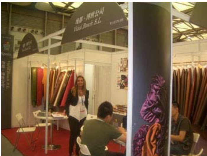
Stand de la feria ACLE durante la pasada edición

Acexpiel, con el patrocinio del ICEX, organizó la participación agrupada de 17 empresas en la pasada edición de la Feria All China Leather Exhibition, celebrada en Shanghai del 3 al 5 de septiembre. La feria coincidió con China International Footwear Fair (CIFF) y Moda Shanghai en el Shanghai New International Expo Centre.